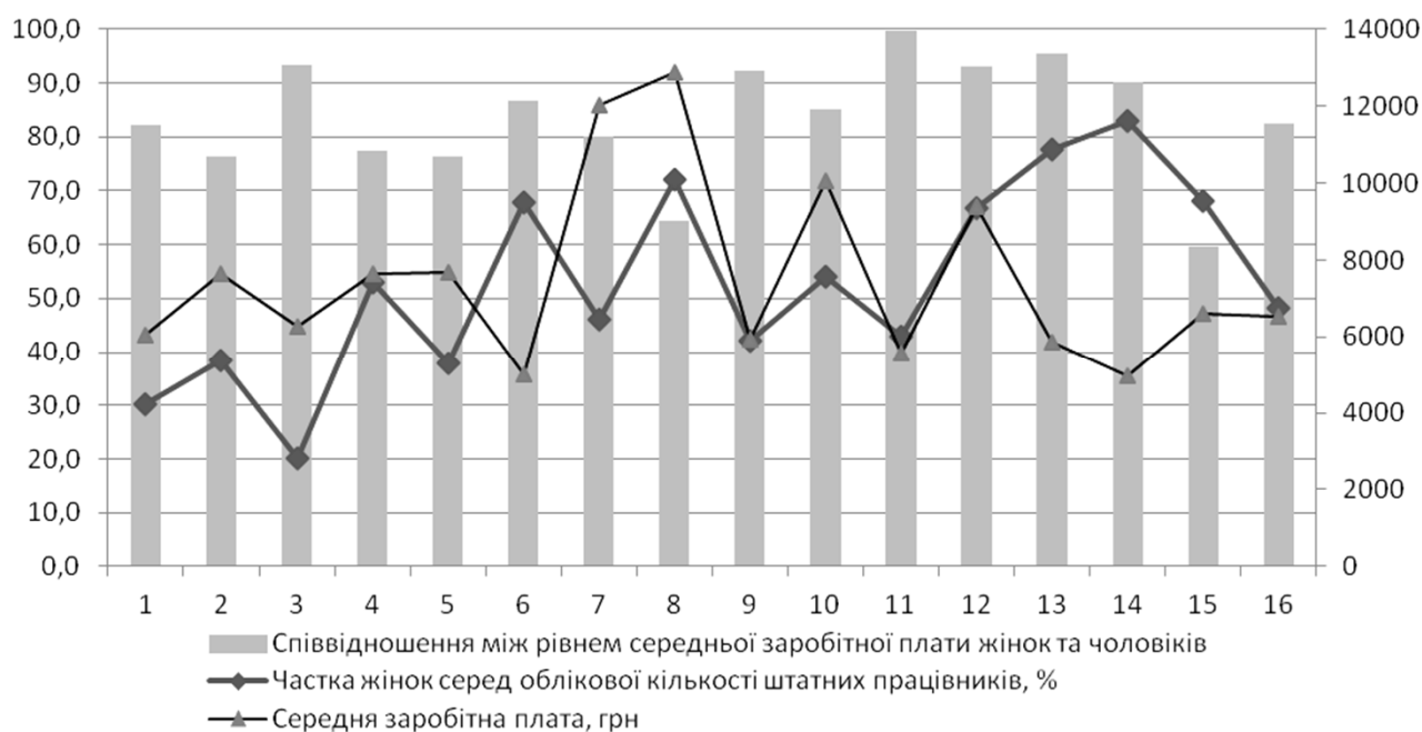
Рисунок 1. Співвідношення чисельності жінок та чоловіків, зайнятих у відповідних видах діяльності у 2017 році та їхньої заробітної плати