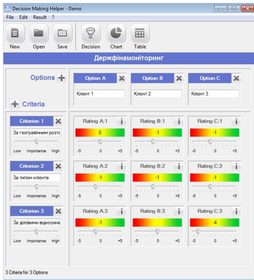
Рисунок 1. Оцінки клієнтів за запропонованим підходом визначення рівня їх ризику

Як видно з Рисунка 1, чим більшої кількості пунктів відповідає клієнт, тим менша його оцінка в програмі і тим більш рівень ризику він має. Так, клієнт 1 за критерієм тип клієнта отримав бал «-1», що відповідає 4 пунктам вимог Держфінмоніторингу [14] (див. Таблицю 1). Аналогічно здійснено оцінювання за іншими клієнтами. Програма Decision Making Helper автоматично визначає рівень ризику за внесеними даними, що наведено на Рисунку 2.